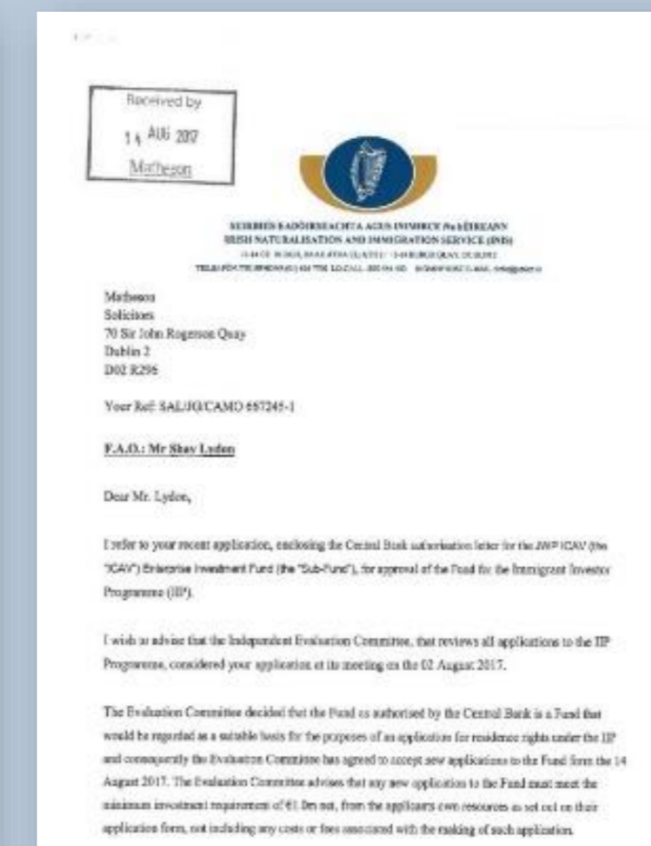
아일랜드 이민국의 펀드 승인서