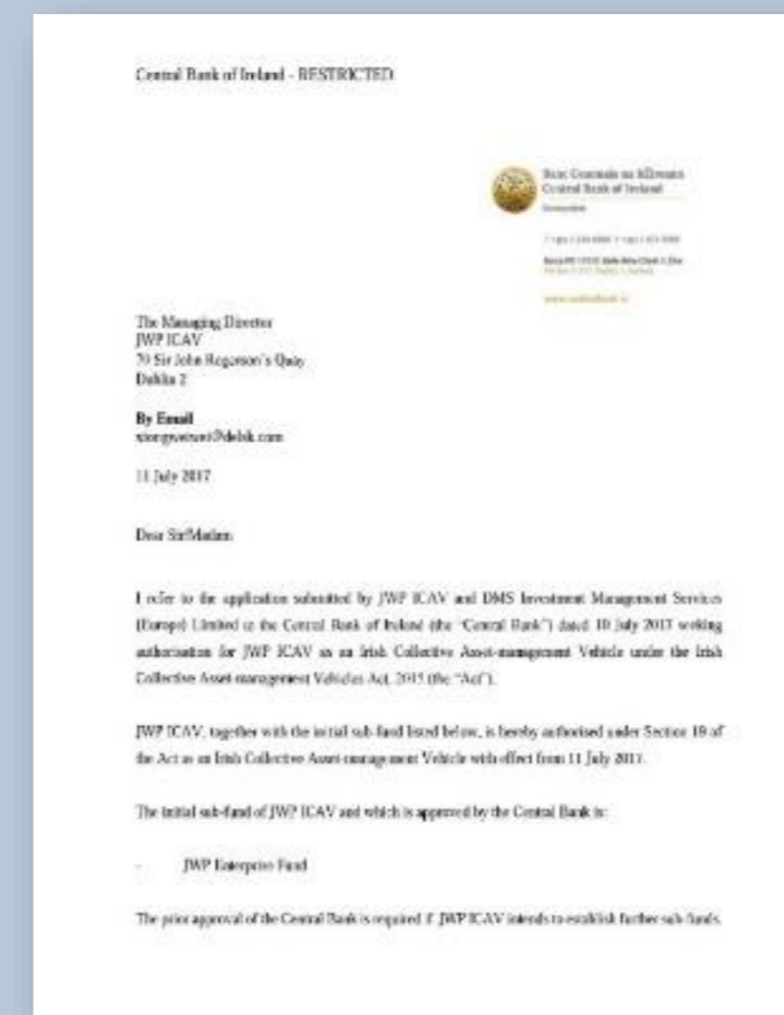
아일랜드 이민국의 펀드 승인서

(최소 투자기간 완료 2개월 전부터 회수 시작 / 3개월 내 회수 완료)